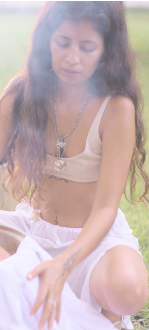
San Ramón Q. Roo 2021